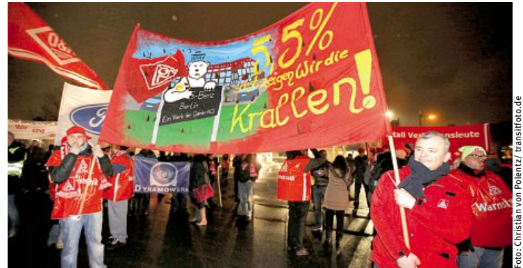
Warnstreik in der Tarifrunde 2015 – Vertrauensleute sind dabei!

Aktiv im Werk Im Werk sind die Vertrauensleute sehr aktiv. Im September wurde der Aktionstag gegen den Missbrauch von Werkverträgen in Berlin gestaltet. Auch die Tarifrunde ist für die Vertrauensleute eine Zeit mit viel Arbeit. Einerseits ar-