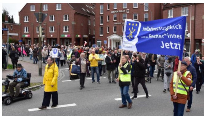
Demonstration mehrerer Verbände für Inflationsausgleich für Rentner am 5. April in Stockelsdorf (Ostholstein)

Das kann nicht das Lebensziel nach 40 Jahren Arbeit sein.