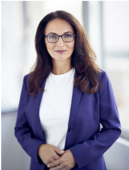
Yasmin Fahimi

Die DGB-Vorsitzende Yasmin Fahimi findet am Rentenpaket II gut, dass zwei Kernforderungen der Gewerkschaften erfüllt sind: Das Rentenniveau bei 48 Prozent zu halten und das Renteneintrittsalter nicht anzuheben.