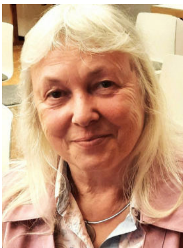
Ich bin die Neue und komme jetzt öfter.

Als „DDR-Kind“ war ich mit Beginn meiner Lehre zur BMSR*)-Technikerin auch automatisch Mitglied im Freien Deutschen Gewerkschaftsbund (FDGB). Bewusst habe ich mich aber 2008 mit der Finanzkrise für den Eintritt in die IG Metall Berlin entschieden.