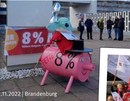
2.11.2022 | Brandenburg