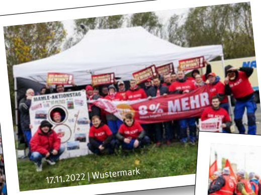
17.11.2022 | Wustermark