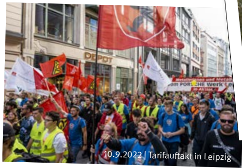
10.9.2022 | Tarifaufakt in Leipzig