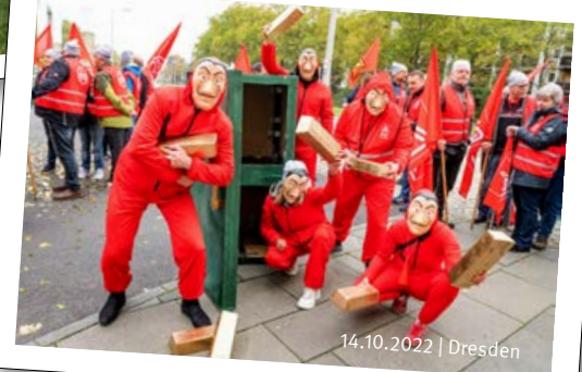
14.10.2022 | Dresden