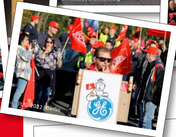
31.10.2022 | Berlin

28.000 Kolleg*innen in Berlin, Brandenburg und Sachsen