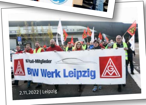
2.11.2022 | Leipzig

28.000 Kolleg*innen in Berlin, Brandenburg und Sachsen