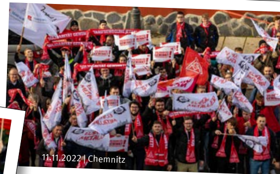
11.11.2022 | Chemnitz