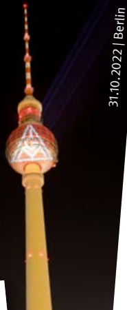
31.10.2022 | Berlin