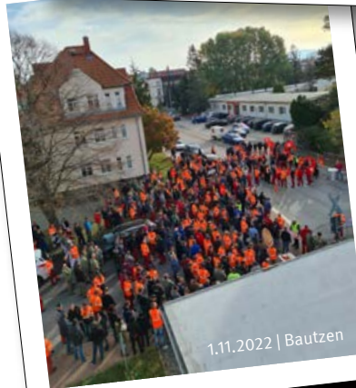
1.11.2022 | Bautzen