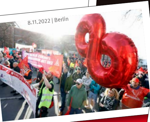
8.11.2022 | Berlin